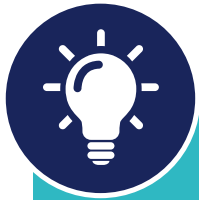
FIGURE 4 : Piliers du retour à la croissance