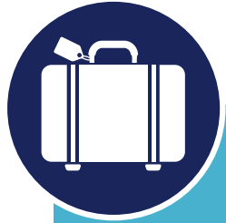
FIGURE 3 : Piliers de la relance